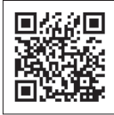
(金融庁ホームページ)

この保険での引受条件(保険金額等)はあらかじめ定められたご契約タイプとなります。ご契約タイプについての詳細は2ページをご確認ください。 保険金額等の設定は、高額療養費制度や労災保険制度等の公的保険制度を踏まえご確認ください。公的保険制度の概要につきましては、金融庁のホームページ( https://www.fsa.go.jp/ordinary/insurance-portal.html )等をご確認ください。(金融庁ホームページ)