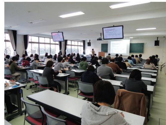
放射線業務従事者に対する教育訓練

The Center consists of three sections, the Management Sections for Chemical Substances, Radiations and Biosafety.