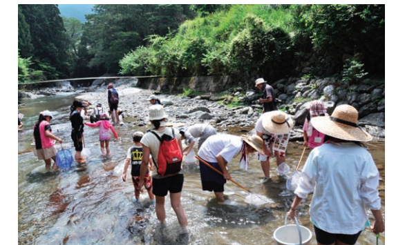
公開の野外体験実習の様子

The Center was established on April 1, 2001 and is dedicated to the study of a scientific discipline termed "KYOUSEI Science", defined as the study for co-existence of human society and natural environments. The Center aims to contribute to the environmental problems through multi-scale scientific research activities from physical chemistry, molecular biology, ecology, geography and geophysics.