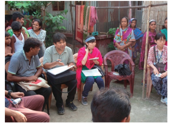
バングラデシュ研修での聞き取り調査

Established on November 25, 2005, the Center is dedicated to promote higher education for women in Asia. In present-day Asia, with its great diversity in history, culture, language and political systems, there are emerging sense of unity and common experiences shared by people living in Asia. The Center aims at addressing diverse gender issues in active collaboration with researchers in Asia and contributes to the society by demonstrating research findings, promoting mobility of researchers and nurturing of next generation with a view to establish gender equality within Asia.