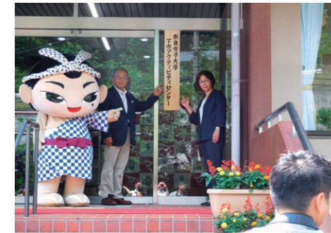
「奈良女子大学下市アクティビティセンター」開所式

In response to the selection of COC+ program, this center was established on December 1, 2015 and is dedicated to promote "Regional Collaboration and Education". Through innovation of education and career support system, this center aims to foster people and adjust environment for regional revitalization in Nara.