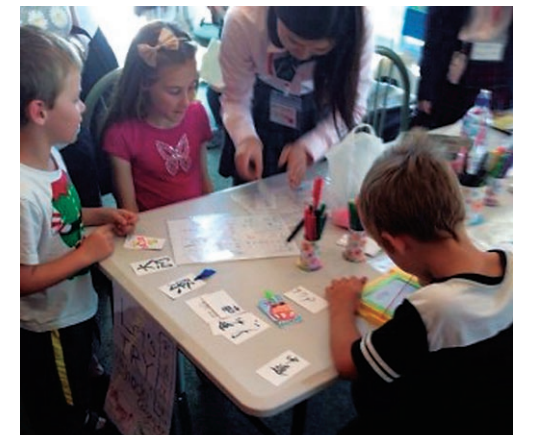
グローバル女性人材プログラムでの日本文化紹介イベント

The center is comprised of the International Exchange Planning Section and the International Education Section. The former carries out the planning and implementation of international exchange and promotes activities based upon academic exchange agreements. The latter offers education and support to international students and guidance for Japanese students going abroad.