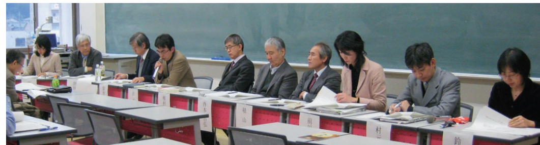
都城制研究会でのシンポジウムの様子

In addition to carrying out its own activities, since fiscal year 2009 this center has taken on the accomplishments of the "21st Century COE Program - COE for Research on formation and characteristics of Ancient Japan", and is widely promoting and releasing interdisciplinary research on ancient Japan in concert with researchers from the field of science. Accordingly, greater development can be achieved through cooperation with the network of domestic and foreign research institutions and researchers built through COE activities.