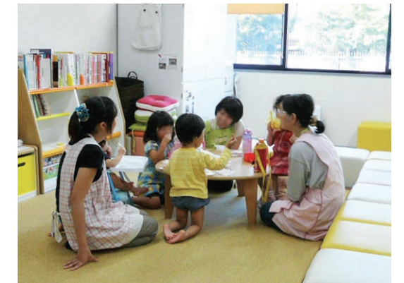
「ならっこルーム」での託児

The first Basic Principle of Nara Women's University is "cultivating human resources that will lead to a gender-equal society and disseminating information for the empowerment of women". The "Gender Equality Promotion Office" was founded in November 2005 to realize this principle by creating an environment where women and men in all fields can actualize their full potential. Its name was changed to the "Organization for the Promotion of Gender Equality" in December 2012, and it is currently comprised of the (1) Office of Gender Equality Awareness, (2) Office of Diversity in Research Environment, and (3) Office of Career Development for Postdoctoral Fellows and Graduate Students. It works to: raise people's awareness of the importance of gender equality; help its researchers with their research and education-related activities; assist its faculty, staff, and students in achieving their optimal balances between work/study and private lives; and support female graduate students and postdoctoral fellows to diversify their career.