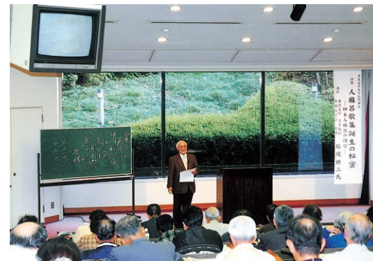
公開講座「人麻呂歌集誕生の秘密」

The Center will survey the promotion of lifelong learning as well as conduct research and development of lifelong learning programs by liaising with local lifelong learning organizations and groups.