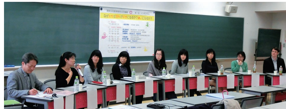
理系女性教育開発共同機構シンポジウムの様子

We carry out education and research in the direction of four projects: Hurdling Assistance for Women in Science Program, Secondary Education Reform Project, Higher Science and Engineering Education Reform Project, and Globalization Project. These are aimed at promoting research for the expansion of career choices in science and engineering for women and developing contextualized teaching materials and methodology in science and mathematics for secondary and higher education, thereby fostering female leaders equipped with scientific thinking.