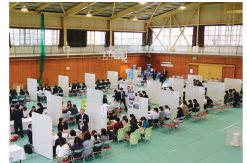
奈良県内魅力発見セミナー