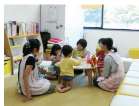
“ならっこルーム”での託児

本学の第1の基本理念「男女共同参画社会をリードする人材の育成ー女性の能力発現をはかり情報発信する大学へー」に基づき、男女ともにあらゆる分野や場面で活躍できる環境をつくるため、平成17年11月に男女共同参画推進室が設置された。平成24年12月に機構に名称変更し、現在は「男女共同参画推進本部」、「ダイバーシティ研究環境支援本部」、「キャリア開発支援本部」の3本部で、男女共同参画の意識啓発、教育研究活動支援、私生活と学業・仕事との両立支援、大学院生やポストドクターのキャリア・パス多様化支援等を行っている。