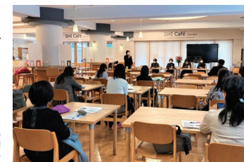
センターの事業に関する討論会(2021年度)の様子

アジア・ジェンダー文化学研究センターは、アジアの女性の高等教育の発展を目的として平成17年11月25日に設置された。アジアの中には、多様な歴史、文化、言語、政治体制を持つ国や地域がありながらも、現在それらの違いを越えてアジアとしての一体感や共通の経験が生まれつつある。本センターは、アジアの研究者とともにジェンダー課題を研究し、ジェンダー平等をめざして情報発信、研究者間の交流、次世代の育成と地域貢献を行っている。