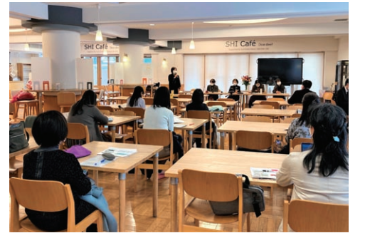
センターの事業に関する討論会(2021年度)の様子

Established on November 25, 2005, the Center is dedicated to promote higher education for women in Asia. In present-day Asia, with its great diversity in history, culture, language and political systems, there are emerging sense of unity and common experiences shared by people living in Asia. The Center aims at addressing diverse gender issues in active collaboration with researchers in Asia and contributes to the society by demonstrating research findings, promoting mobility of researchers and nurturing of next generation with a view to establish gender equality within Asia.