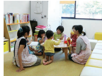
“ならっこルーム”での託児

本学の第1の基本理念「男女共同参画社会をリードする人材の育成ー女性の能力発現をはかり情報発信する大学へー」に基づき、男女ともにあらゆる分野や場面で活躍できる環境をつくるため、平成17年11月に男女共同参画推進室が設置された。平成24年12月に機構に名称変更し、現在は「男女共同参画推進本部」、「ダイバーシティ研究環境支援本部」、「キャリア開発支援本部」の3本部で、男女共同参画の意識啓発、教育研究活動支援、私生活と学業・仕事との両立支援、大学院生やポストドクターのキャリア・パス多様化支援等を行っている。